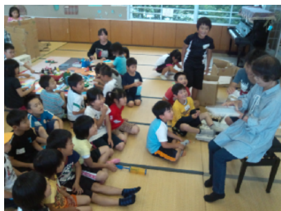
七夕：絵本の読み聞かせ